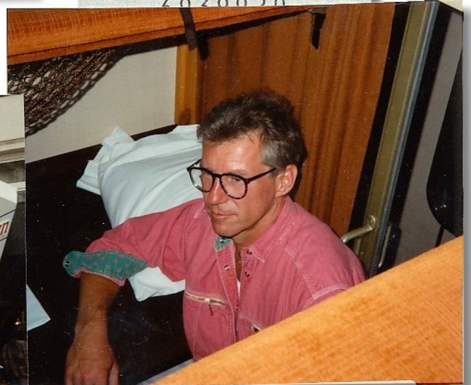
Zug - Bett - Geschichten