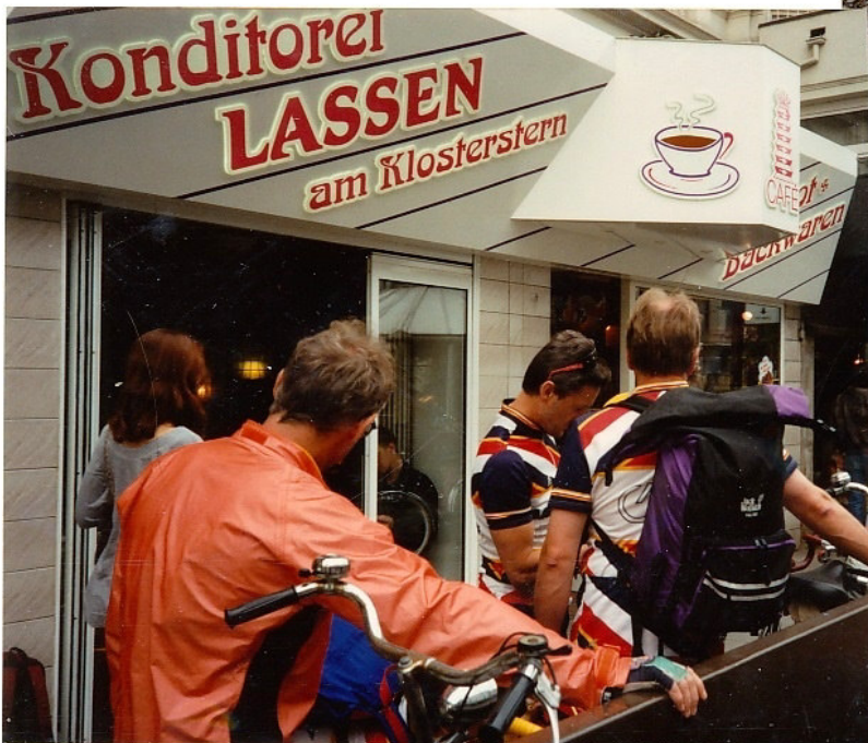
Gehattvolles Frühstück in HAMBURG