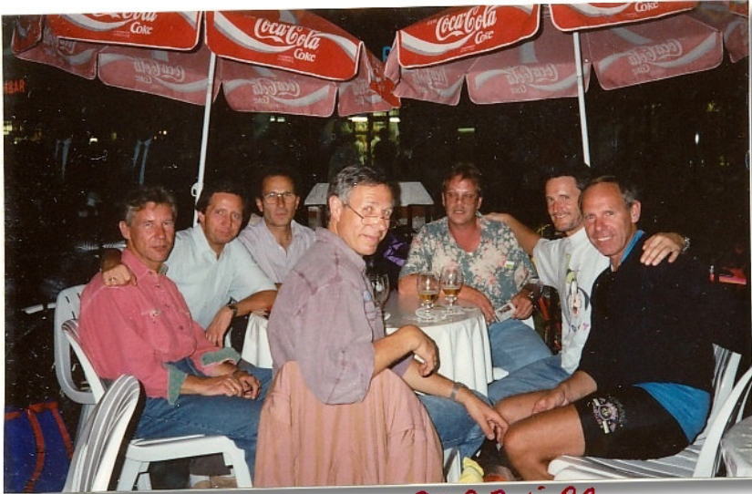
Do. 9. Juli 92 Treff im Hbf-Stgt.